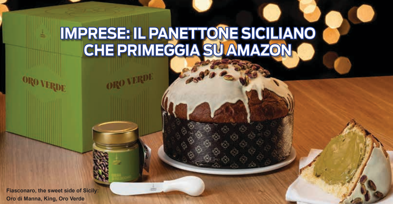
Fiasconaro, the sweet side of Sicily: Oro di Manna, King, Oro Verde

(NoveColonneATG) Palermo - Investimenti, innovazione, sostenibilità, internazionalizzazione, rapporto con il territorio queste alcuni tra i criteri di eccellenza che Intesa San Paolo ha valutato nell'assegnare il riconoscimento imprese vincenti, a circa 4mila PMI che con il loro lavoro quotidiano nobilitano il Made in Italy. Tra le eccellenze segnalate in questa selezione c'è Fiasconaro, azienda dolciaria di Castelbuono, nel palermitano, con 22 milioni di fatturato nel 2019 ed una crescita del 20% dell'export e con 6000 clienti sparsi per il mondo. Una azienda che nonostante la sua internazionalizzazione non dimentica le difficoltà economiche del proprio territorio e reinveste 45% del fatturato, in una rete di aziende locali in grado di garantire l'approvvigionamento di materie prime (tra le tante, nocciole, mandorle, miele, cioccolato, frutta, uva sultanina e cioccolato) contribuendo a ridurre lo spopolamento nell'area delle Madonie. La forza di questa eccellenza Made in Italy la conosce anche Amazon, tanto che ha posizionato il panettone siciliano di Fiasconaro facendolo diventare uno dei più venduti del web. I loro dolci hanno servito di tre Papi, sono andati in orbita nello Shuttle Discovery e tra le braccia del leader cinese Xi Jinping,