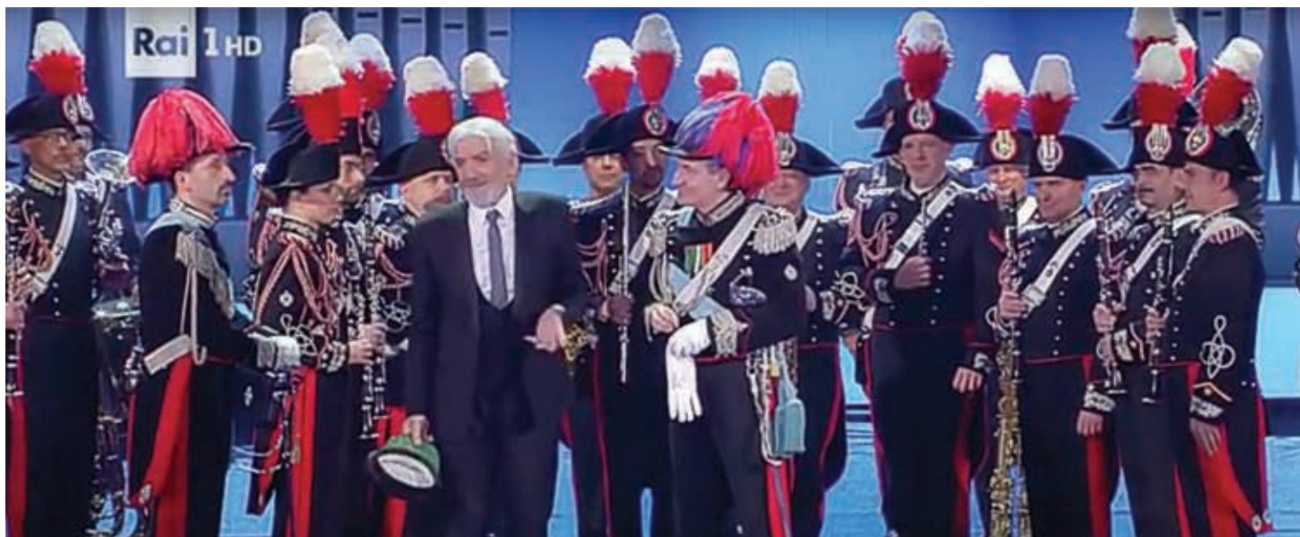
Il maresciallo Rocca e la Banda dei Carabinieri - Cavalli di battaglia RAI 1 / 23/06/2018

a Carmelo Bene, nel 1976 stringe un sodalizio con lo scrittore Roberto Lerici, insieme al quale scrive e dirige i suoi spettacoli rimasti nella storia, A me gli occhi, please è un trionfo. Lo riporta in scena nel 1993, nel 1996 e nel 2000, Continua a girare film, serie tv. Nel 1996 è protagonista della serie dei record d'ascolto Il maresciallo Rocca nel ruolo di un carabiniere padre di quattro figli che tutti gli italiani vorrebbero incontrare, ma prima c'erano stati Un figlio a metà, Italian restaurant. In tv fa il varietà da Fatti e fattacci a Fantastico ma il teatro è la sua vita e la sua passione. Doppia Sylvester Stallone che grida «Adrianaaaaa!», nel primo Rocky. Di recente aveva partecipato alla nuova stagione di Ulisse con Alberto Angela.