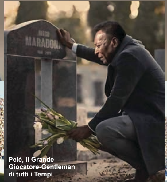
Pelé, il Grande Giocatore-Gentleman di tutti i Tempi.

Una telecamera da lontano ha ripreso senza audio il momento di intimità, dopo una giornata segnata dalle lacrime, le grida ed i cori di decine di migliaia di persone che lo hanno salutato dentro e fuori della Casa Rosada presidenziale, in uno scenario non privo di violenza.