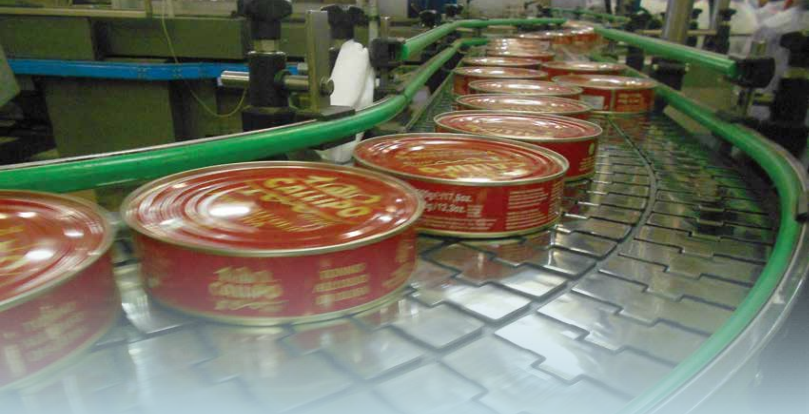
Il processo di produzione del tonno in scatola Callipo.