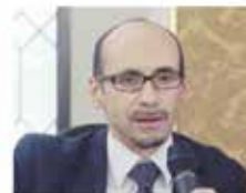
180.000 € GIUSEPPE BUSIA PRESIDENTE ANAC