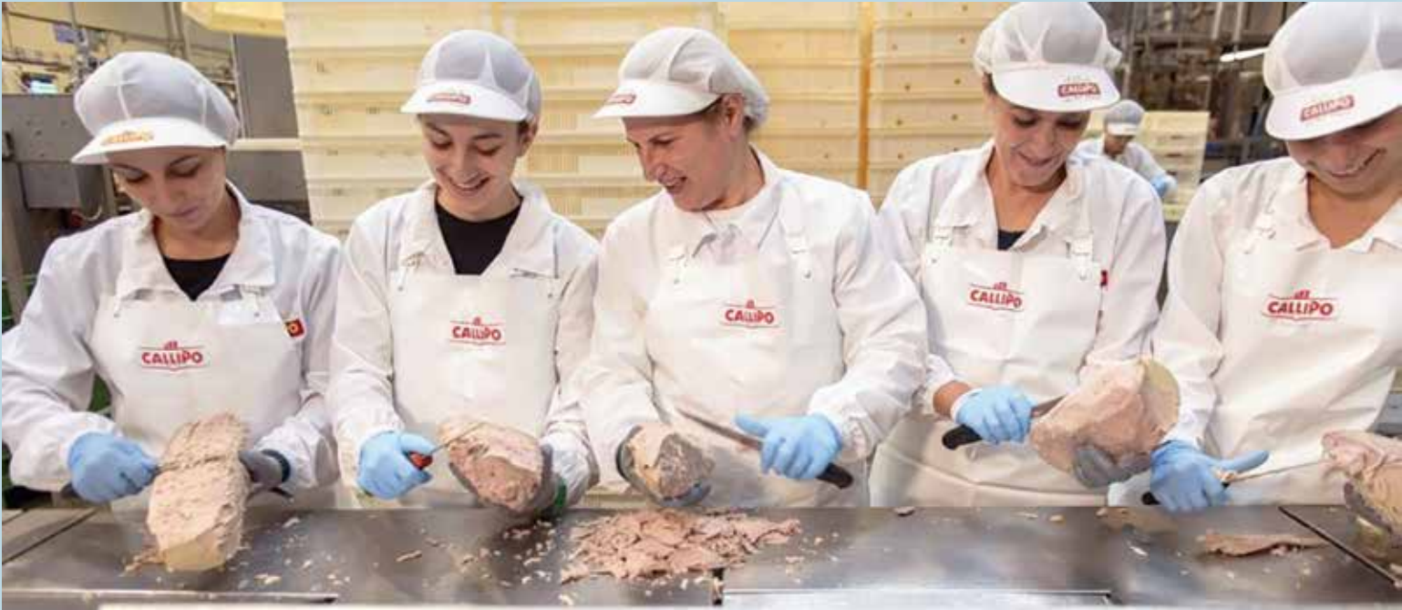
Operaie nello stabilimento Callipo.

Callipo Conserve Alimentari tra le Best Managed Companies nazionali.