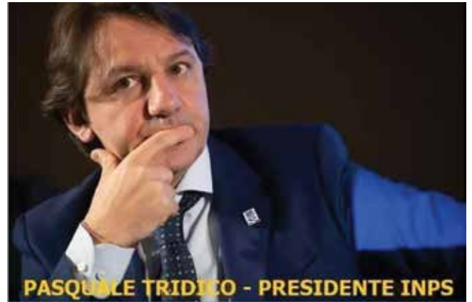
PASQUALE TRIDICO - PRESIDENTE INPS