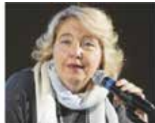
240.000 € GABRIELLA DI MICHELE DIRETTORE GENERALE INPS

Ora è stato oggetto di critiche e minacce ma noi gli esprimiamo il nostro apprezzamento: chi prende soldi destinati agli italiani in difficoltà si deve dimettere.