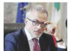
240.000 € ERNESTO MARIA RUFFINI DIRETTORE AGENZIA DELLE ENTRATE