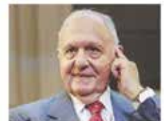
187.333 € PAOLO SAVONA PRESIDENTE CONSOB