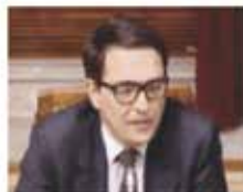
240.000 € GIACOMO LASORELLA PRESIDENTE AGCOM