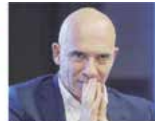
174.000 € FABRIZIO SALINI AMMINISTRATORE DELEGATO RAI