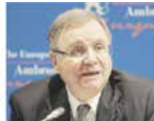
450.000 € IGNAZIO VISCO GOVERNATORE DELLA BANCA D'ITALIA