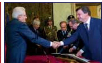
Made in Italy: 2015 Anno record per l'export italiano p.15