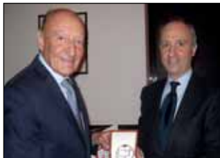
Premio GEI p.12