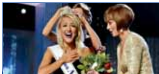
Savvy Shields ha vinto il titolo di Miss America 2017 p.12