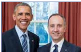
l'Ambasciatore Varricchio presenta le sue credenziali al Presidente Obama p.13

La Voce vi propone le 10 migliori spiagge degli Stati Uniti di America. Due delle 10 sono queste: Fort Lauderdale Beach e Miami Beach p. 9