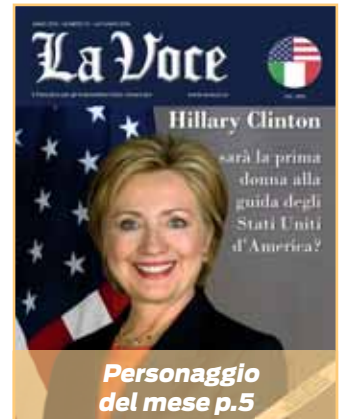
Personaggio del mese p.5