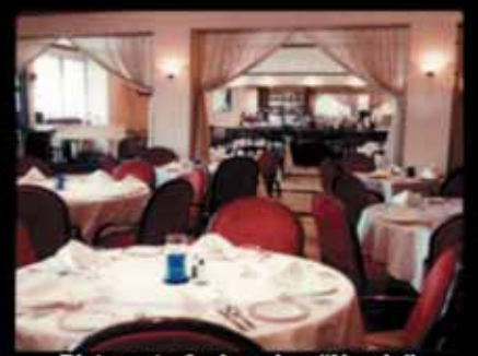
Ristorante & piano bar "Nando"

2500, east Hallandale Beach Blvd. Tel. (954) 457.7379 www.nandosrestaurant.com