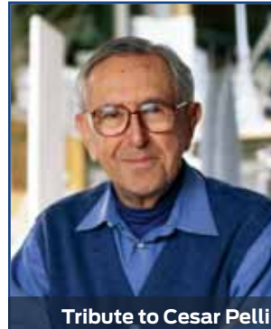
Tribute to Cesar Pelli Italian - Argentinian Architect p. 6-7