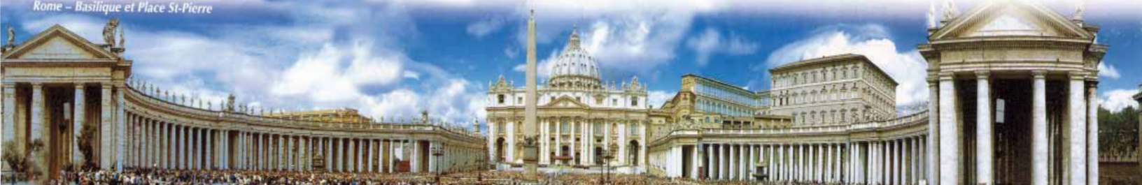
Rome - Basilique et Place St-Pierre