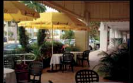
Panoramica della terrazza