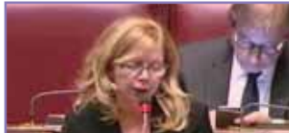
On. Nissoli promuove la dieta mediterranea nel mondo p. 8

Affiliazioni: Camere di commercio italiane nell'area NAFTA (FUSIE) Roma Bibliothèque Nationale du Québec Archive Nationale du Canada