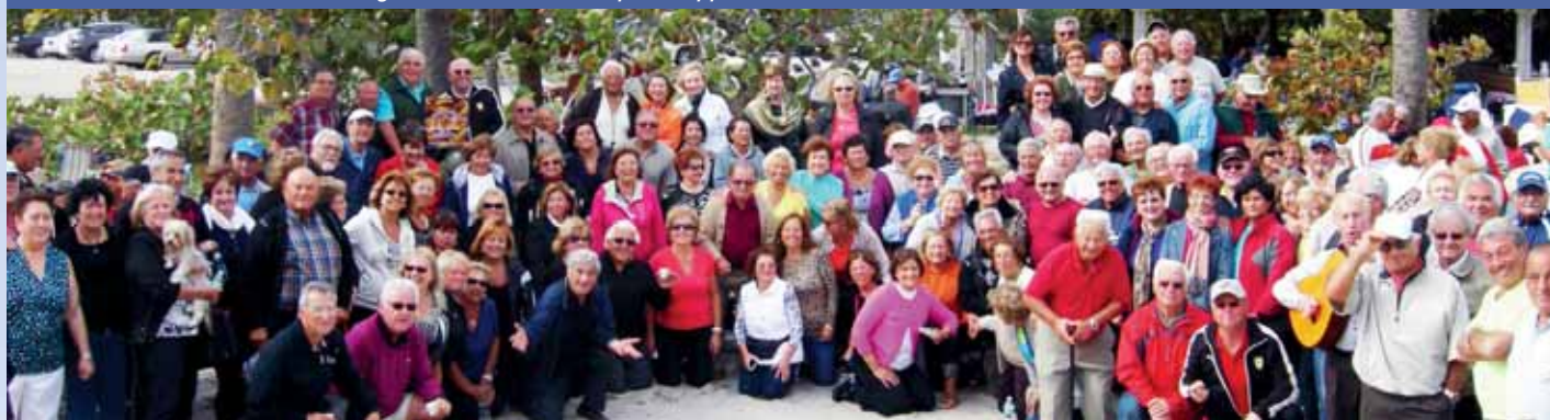
PicNic 2013. Una parte dei turisti italo-canadesi in vacanze ben meritate

Errata corrige edizione estate n.71 p.12 L'appuntamento è il 21 febbraio 2017 e non il 27 febbraio 2017