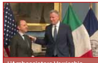
L'Ambasciatore Varricchio presenta l'Italia in USA. Prima tappa della Campagna #ITALIAN p.13