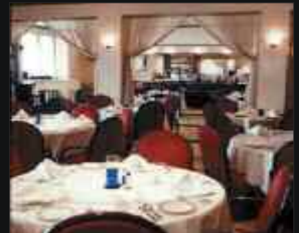
Ristorante & piano bar "Nando"

"I make original recipes with the freshest meat, seafood and vegetables available to me that day."