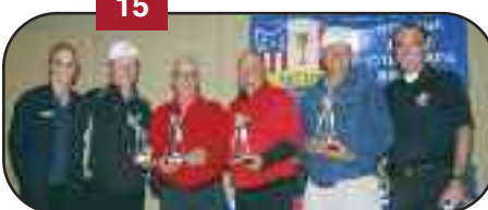
RBC Bank Golf Gagnants 2013