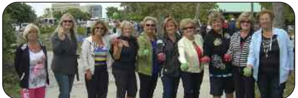
Anche le campionesse di bocce hanno coronato il successo della giornata.