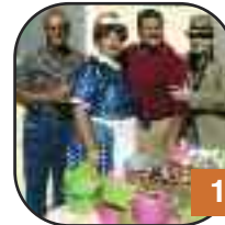
La Mascotte "I Love You"