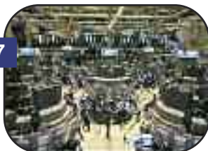
Storico record a Wall Street