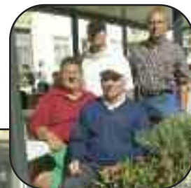
alcuni amici della festa con il Presidente in secondo Piano.