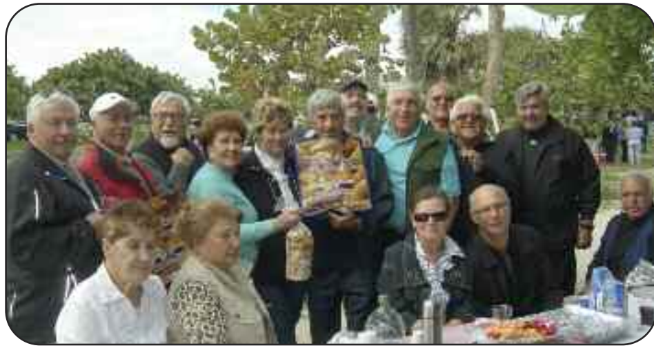
Una mezza dozzina di "Begel St-Viateur" rese felici le prime 100 coppie presenti.