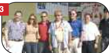
Grande successo del "CanadaFest"