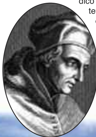
Papa Gregorio XII

Papato, per mettere fine alla scissione, abdicò per far eleggere un unico Pontefice. Solo che il nuovo Papa fu eletto due anni dopo la morte di Gregorio, e fu così eletto Martino V.