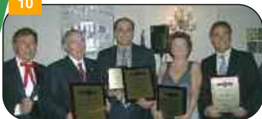
La Fondazione Alzheimer Stella Mattutina consegna i premi