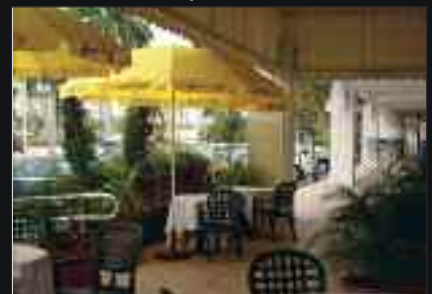
Panoramica della terrazza

The restaurant is open every day for dinner from 4:30PM to 11:00PM