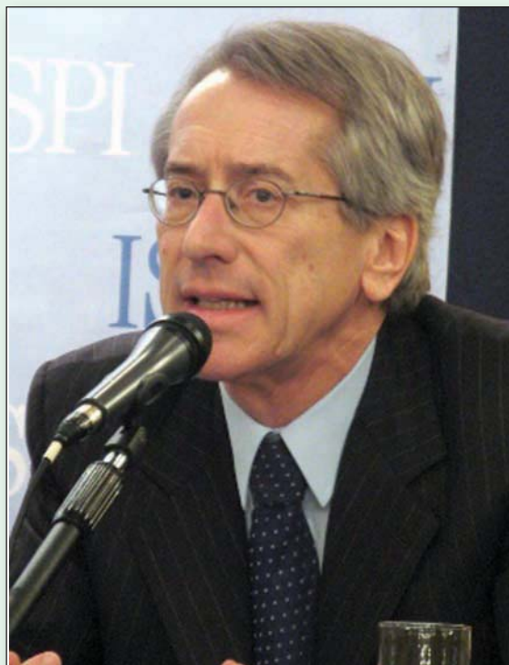
S.E. Giulio Terzi

rata alle Nazioni Unite, ho trovato sempre conferma della strettissima unità d'intenti che lega Roma e Washington su questioni vitali della convivenza tra i popoli quali la sicurezza internazionale, l'economia, la tutela dei deboli, la protezione dell'ambiente: lo sforzo comune in Afghanistan, l'impegno per il disarmo, il sostegno al ruolo dell'Onu nel settore delle operazioni di pace e dei diritti umani sono solo alcuni dei punti più qualificanti di un'azione congiunta che Italia e Stati Uniti hanno ancor più intensificato in questi ultimi anni.