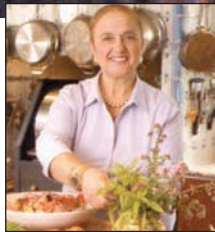
Lidia Matticchio Bastianich