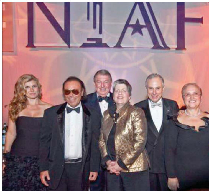
Tutti i festeggiati