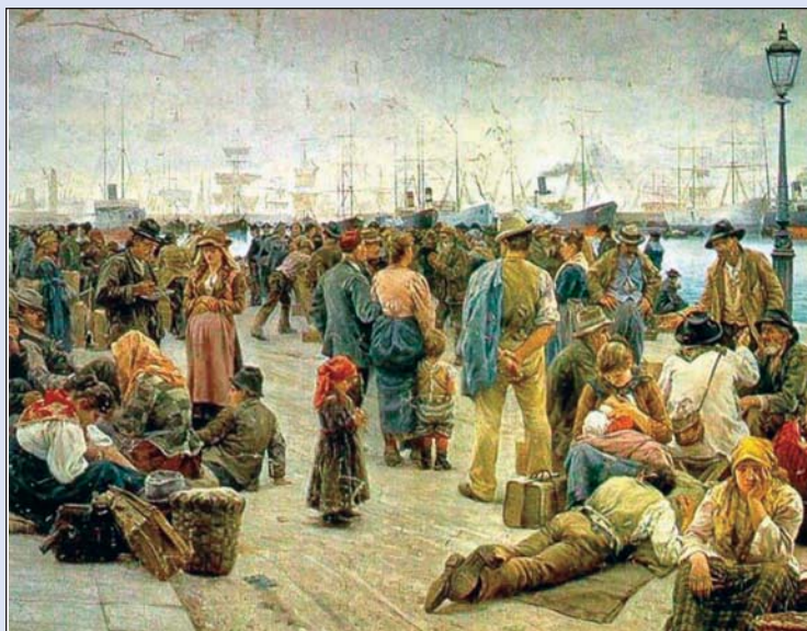
Emigranti degli anni 50