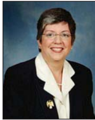
Janet Ann Napolitano P. 16