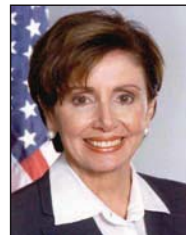
Nancy Pelosi p. 16