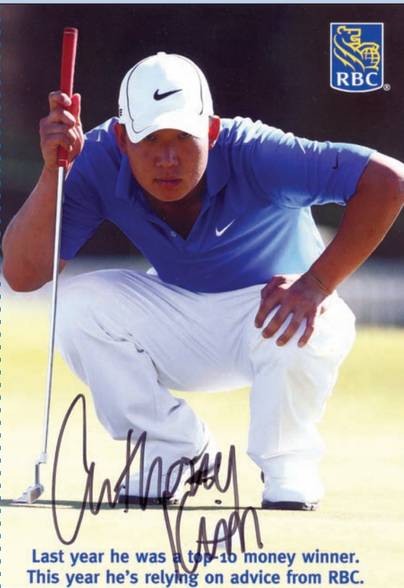
Last year he was a top-10 money winner. This year he's relying on advice from RBC.

M iami, march 10, 2009 — RBC announced today that Anthony Kim, two-time PGA TOUR winner and eleventh ranked golfer in the world, has selected RBC as his exclusive worldwide financial partner and the parties have reached a multi-year endorsement agreement. RBC is the title sponsor of the RBC Canadian Open, Canada's national golf championship and the third oldest national championship in the world.