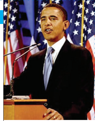
Il nuovo presidente degli Stati Uniti Barack Obama

Questa scelta ha confermato una decisione coraggiosa e rivoluzionaria per l'America che ha scelto Obama per guidarla lungo una nuova strada in un periodo fra i più difficili della sua storia.