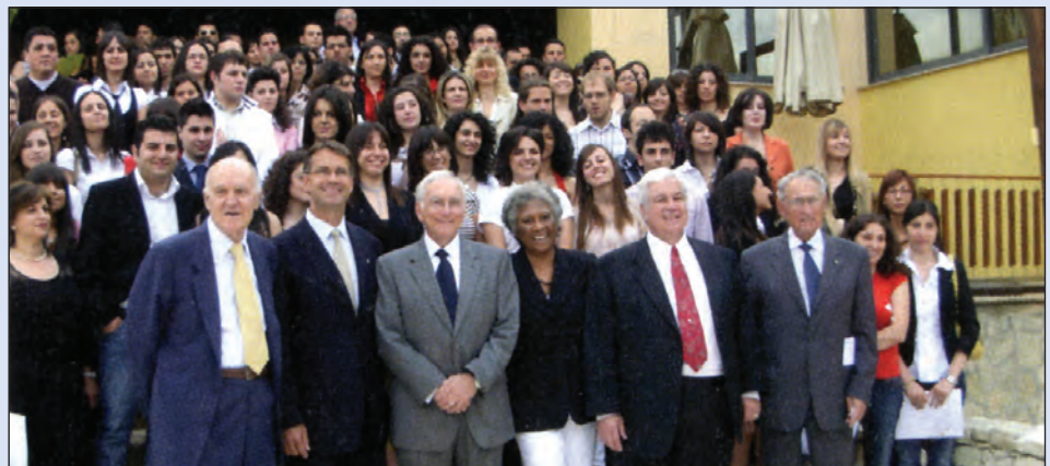
I vincitori delle borse di studio con i dirigenti della Hohn-Mott Scholarship Foundation