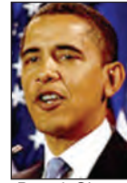
Barack Obama p. 31