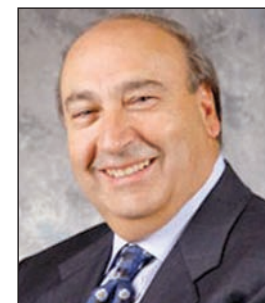
Senatore Renato Turano

membro dell'esecutivo della Consulta regionale della Calabria Rappresentante per il Nord America